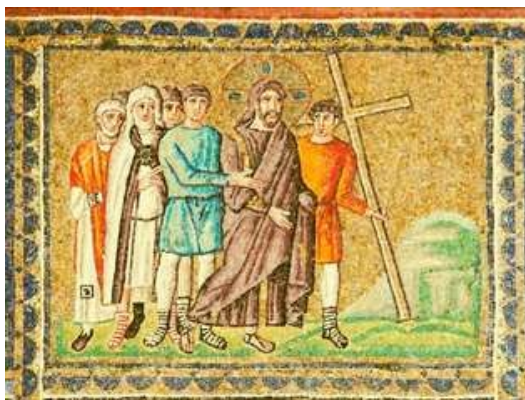
11. ábra Krisztus kereszthordozása a San Apollinare Nuovo ariánus mozaikján

A San Apollinare Nuovo templomot eredetileg Theodorik király építtette 500 körül palotájához csatlakozó házi templomaként, Krisztus Megváltónknak címezve. Az ikonográfiai program Jézus életét bemutató mozaiksort az ariánus előírásoknak megfelelően készítették el. Krisztus szenvedéseit: megostorozását, kicsúfolását, kereszthalálát egyáltalán nem ábrázolták - ezek a szégyenteljes mozzanatok nem fértek össze az ariánus felfogással.