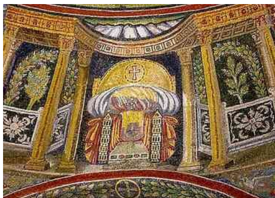
14. ábra Trónok és oltárok a bizánci angyal rendeknek megfelelően az ortodox keresztelőkápolna mozaikján

IV.-V. században újra jelentkezik a kérdés: ha Krisztus valóban Isten, hogyan lehet ember is? Lehet-e mindkettő egyszerre? Vita az Isten(fia) és ember egységéről Krisztusban a khalkedóni dogmát készítette elő. 18 A viták során letisztultan megfogalmazódik az alapkérdés: hogyan állhat fenn Jézus Krisztusban Isten és ember egysége? A válasz annál fontosabb, mert az embernek Isten által történő megváltása csak ebben az egységben képzelhető el. Az ariánus vitákban ismételten fölvetődik a kérdés: Logosz-test vagy Logosz-ember modelljében képzelhető-e el Isten és ember egysége.