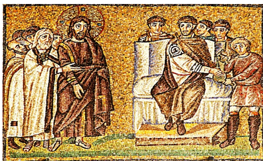
10. ábra Krisztus Pilátus előtt – idős, fáradt, szakállas Jézus

a San Apollinare Nuovo ariánus mozaikján