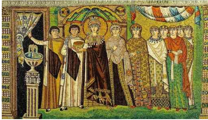
16. ábra Theodora császárnő ünnepélyes ábrázolásán a három királyok imádásának

ortodox jelenetét viseli császári bíbor köntösének szélén