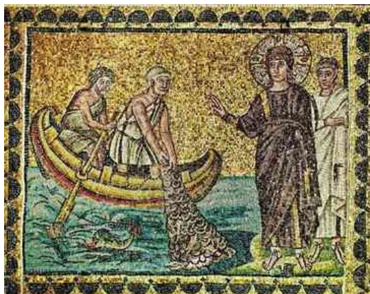
9. ábra Krisztus elhívja tanítványait – fiatal szakálltalan Jézus

Áriusz tanainak rejtett monofizitizmusának az volt a fontos, hogy az Atyaisten eredetnélküliségét, öröklését hangsúlyozzák: ez kizárta mind a keletkezést, mind a születést. Áriusz szerint Isten kezdetben egészen egyedül volt, nem volt sem Ige, sem Bölcsesség, csak „később”, a teremtéshez hozta létre, abból a célból, hogy a teremtést elvégezze, az Igét, a Bölcsességet fiává fogadja, s ezáltal maga Atyává lesz. Áriusz a görög logosz-szarx sémára épít: a teremtett isteni Logosz-Fiú egy lélektelen emberi testet ölt magára. Ha a Logosz emberi érzelmek, szenvedés szubjektumává válhat akkor - Áriusz szerint - nem lehet isteni lényegű. Ha a Fiú testben születésétől alá van vetve a növekedésnek, az éhségnek, a szomjúságnak, a fáradtságnak, és nem ismeri a végítélet napját sem, hogyan lehetne isten? Maga a szenvedés a keresztúton és a kereszten - mindennek a betetőzése, mindez Áriusz szerint összeegyeztethetetlen az isteni természettel.