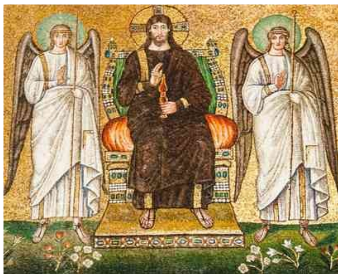
8. ábra Krisztus második eljövételének ábrázolása a San Apollinare Nuovo templomban - megfelelt a bizánci ortodoxiának

Az Újszövetség sokféleképpen fejezi ki, hogy a felmagasztalt Jézus véglegesen egy az Atyával, feltámadt testével együtt. A megtestesülés nem átmeneti kalandja volt a preegzisztens Fiúnak, hanem maradandó jelentősége van: Isten örökre magánál akarja tartani az embert. A felmagasztalással Jézus embersége is véglegesen belép Isten dicsőségébe, amelyben az Örök Fiú öröktől részesedett. 12