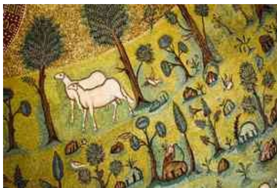
4. ábra Flóra és fauna a San Apollinare di Classe mozaikján