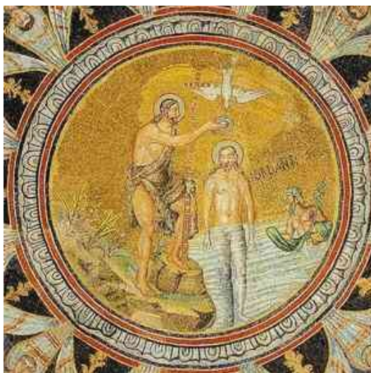
6. ábra Jézus megkeresztelése Neon keresztelőkápolnijában - az ortodox bizánci előírásoknak megfelelően ábrázolva

"Jézus tehát nem önmagától Isten 7 , hanem az Istenre nézvést az... így a szabad akaratának helyes használata által (és engedelmissége által) oly tökéletességre emelkedett, hogy az Isten őt Fiául fogadta, Istenné lett, és most joggal Istenként imádtatik." – ez lehetett Áriusz tanítása. 8 A kereszténység, a maga történeti útján ebben a vonatkozásban végül János evangéliumának sokkal metafizikusabb tartalmát fogadta el, tagadva Jézus és az Atyaisten Áriusz féle szétválasztását: „Én és az Atya egy vagyunk.” 9