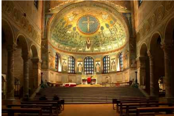
1. ábra A San Apollinare di Classe apszisa

„Az Isten sokkal fönségesebb, semhogy a világot közvetlenül alkotta volna és vele közvetlen érintkezésben állhatna; másrészt meg az Isten közvetlen színe látását maga a teremtés sem viselheti el. Ha tehát az Isten e világot alkotta, szüksége volt egy közvetítő lényre, mintegy eszközre vagy segítőre a „teremtésnél”, és ez a közvetítő lény az ige vagyis a Fiú (Jézus), kinek lényege ennél fogva nem egyenlő az Atyával, hanem attól egészen különböző, mert máskülönben Ő sem hozhatta volna létre a világot.”