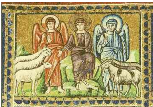
7. ábra Krisztus ítélete a bárányok és kecskék között a San Apollinare Nuovo templomban az ariánus elveknek megfelelő ábrázolás

Az Újszövetség sokféleképpen fejezi ki, hogy a felmagasztalt Jézus véglegesen egy az Atyával, feltámadt testével együtt. A megtestesülés nem átmeneti kalandja volt a preegzisztens Fiúnak, hanem maradandó jelentősége van: Isten örökre magánál akarja tartani az embert. A felmagasztalással Jézus embersége is véglegesen belép Isten dicsőségébe, amelyben az Örök Fiú öröktől részesedett. 12