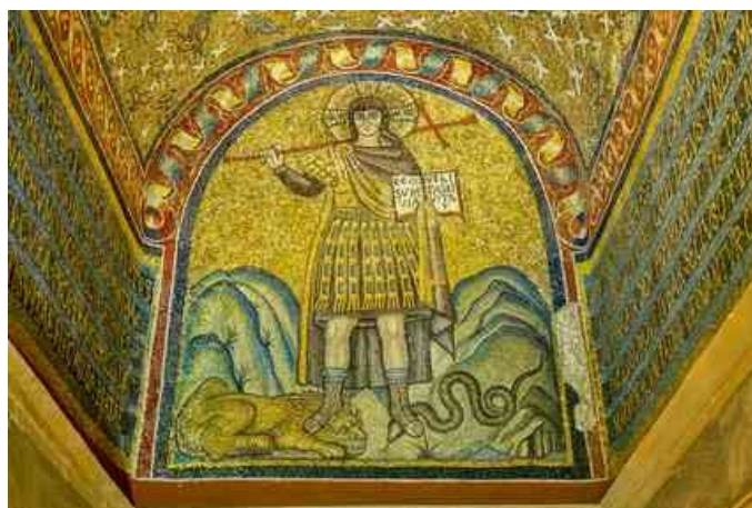
12. ábra A győzelmes Krisztus ábrázolása a San Andreas érseki kápolna nartexében

Az ókori kereszténység Jézus halálához és feltámadásához köti Jézus démoni hatalmak feletti győzelmét. A legrégebbi palesztin Jézus-hagyomány azonban már földi működésében is ezt látja végbemenni, erre utalnak egyes logionok: „Így válaszolt nekik: „Láttam a sátánt: mint a villám, úgy bukott le az égből. Hatalmat adtam nektek, hogy kígyókon és skorpiókon járjatok, hogy minden ellenséges erőn úrrá legyetek. Nem fog ártani nektek semmi.” 15 Isten országának kezdetével a démonok visszavonulásra kényszerülnek, hatalmuk megtörik, a világ már nem az isteni és démoni hatalmak egymás közötti csatáinak csatatere, hanem Isten teremtése, amelyet megvilágít Isten eljövendő uralmának fénye.