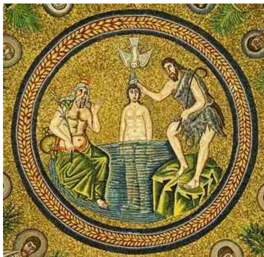
5. ábra Keresztelési jelenet az ariánus keresztelőkápolna kupoláján

Az ószövetségi zsidó gondolatvilágban a Messiás áll a jövődölések középpontjában, de nincs szó arról, hogy a Messiás már földi élete előtt is személyes léttel rendelkezne. Pálnál és Jánosnál fordulat áll be a teológiai gondolkodásban: a felemelkedő krisztológiát, amelyben az ember Krisztust Isten saját fiának fogadta, felmagasztalta és megdicsőítette, leszálló krisztológia váltja fel, amelyben az Istennek a teremtés előtt is már létező, örök Fia száll le, aki nem ember, de elválaszthatatlanul összekapcsolódik az ember názáreti Jézussal minden ember üdvösségére.