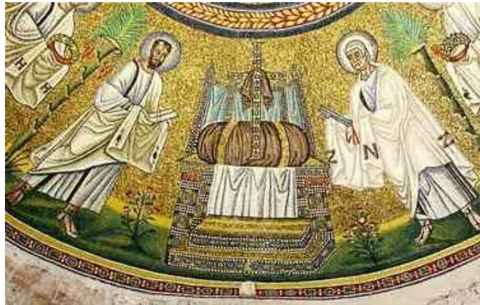
13. ábra A Kereszt imádása az ariánus keresztelőkápolna mozaikján

"az Isten fia (az Ige) nincsen öröktől fogva, nem ugyanazon lényegű az Atyával, hanem az Isten elsőszülöttje, az Atya mindenható akarata által a semmiből jött létre; az első és legnemesebb valóság, mely által aztán a világ teremtett;...Ő Isten és a világ között létező középvaló (közvetítő személy), idővel az ember Jézussal eggyé vált, illetve Ő maga lett Jézus Krisztus."